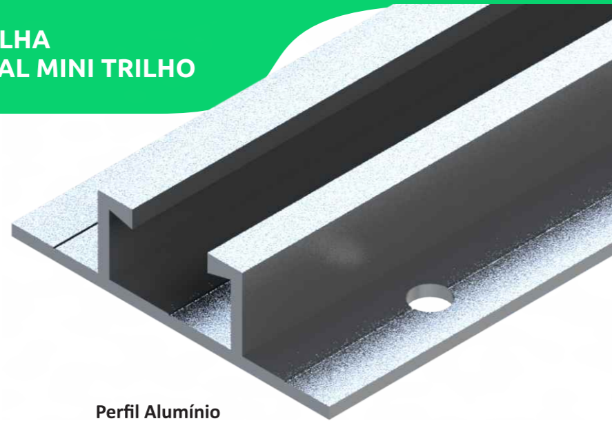
Perfil Alumínio Minitrilho 55 cm