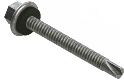
Parafuso Brocante Ø5,5 x 25