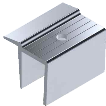
Chapa Trava Grampo Final