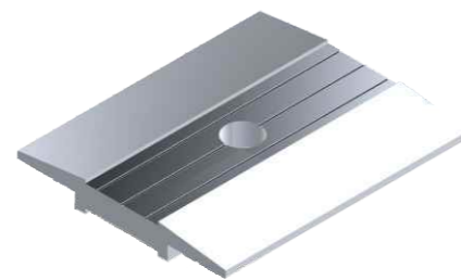
Chapa trava Grampos Intermediários