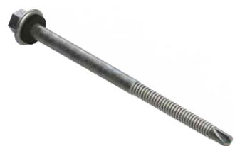
Parafuso Brocante Ø5,5 x 100 x 50