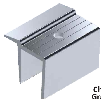
Chapa Trava Grampo final