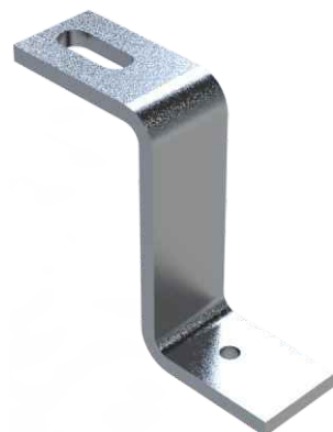
Ganchos "Z" Ondulada