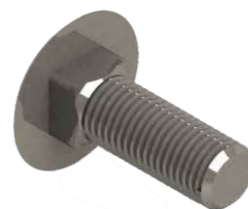
Parafuso Francês M 8 x 25