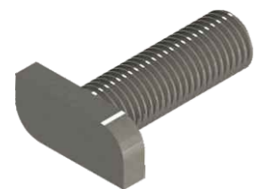
Parafuso T M 8 x 25 mm