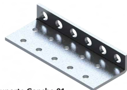
Suporte Gancho 01 Colonial