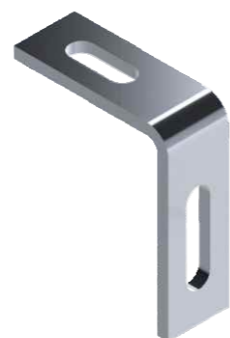
Chapa "L" de Ligação Colonial