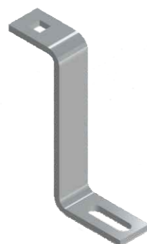
Ganchos "Z" Colonial