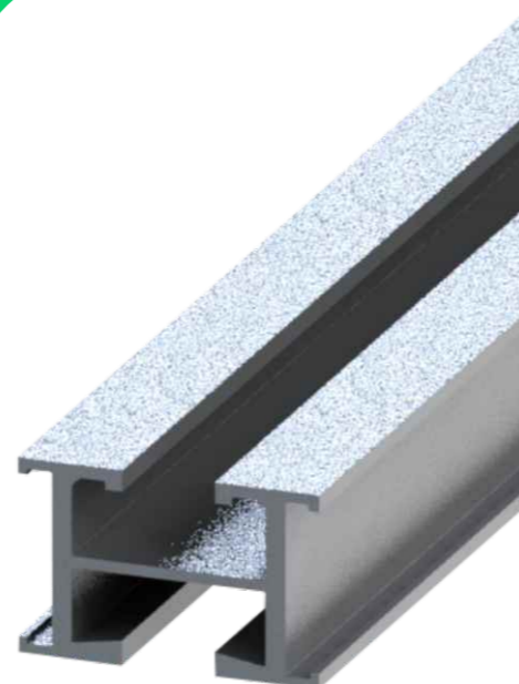
Perfil Alumínio H