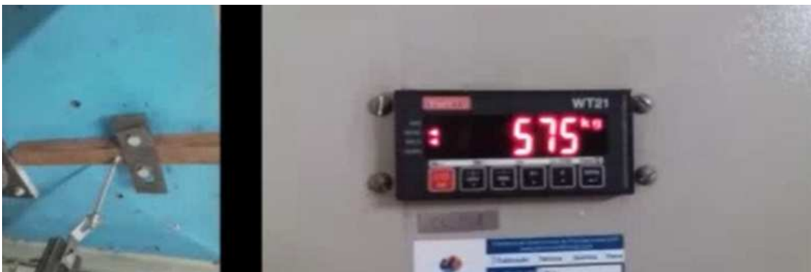
Foto do Ensaio